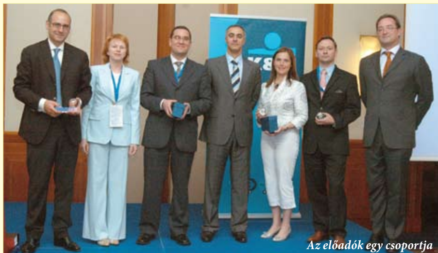
Az előadók egy csoportja

Maive Rute, az Európai Bizottság KKV főigazgatója beszédében kihangsúlyozta, hogy mai globális gazdaságban a piacra lépéshez elengedhetetlenek a nemzetközi ismeretek. A kis- és középvállalkozásoknak ugyanakkor szükségük van az állami támogatásra, különben nem tudnak belépni az új piacra. A versenyképesség